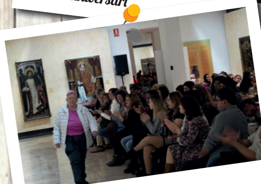
TBC Fhasion Show