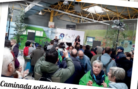
Caminada solidària del Taller Baix Camp