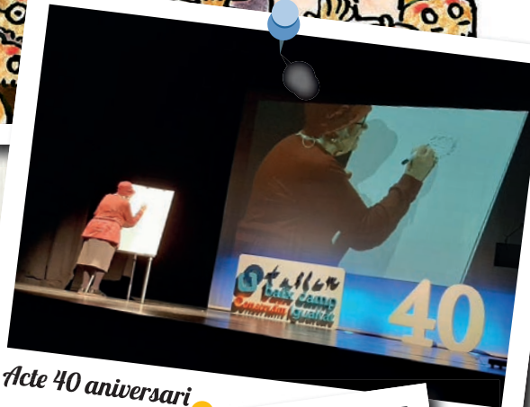
Acte 40 aniversari