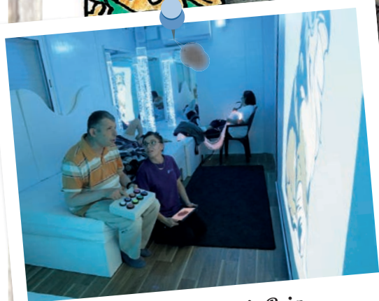
Sala multisensorial de Masia Roig